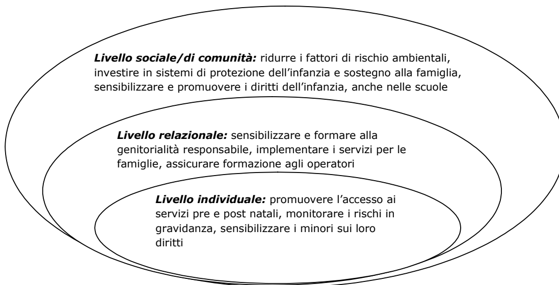
Figura 2. Prospettiva ecologica: strategie preventive.