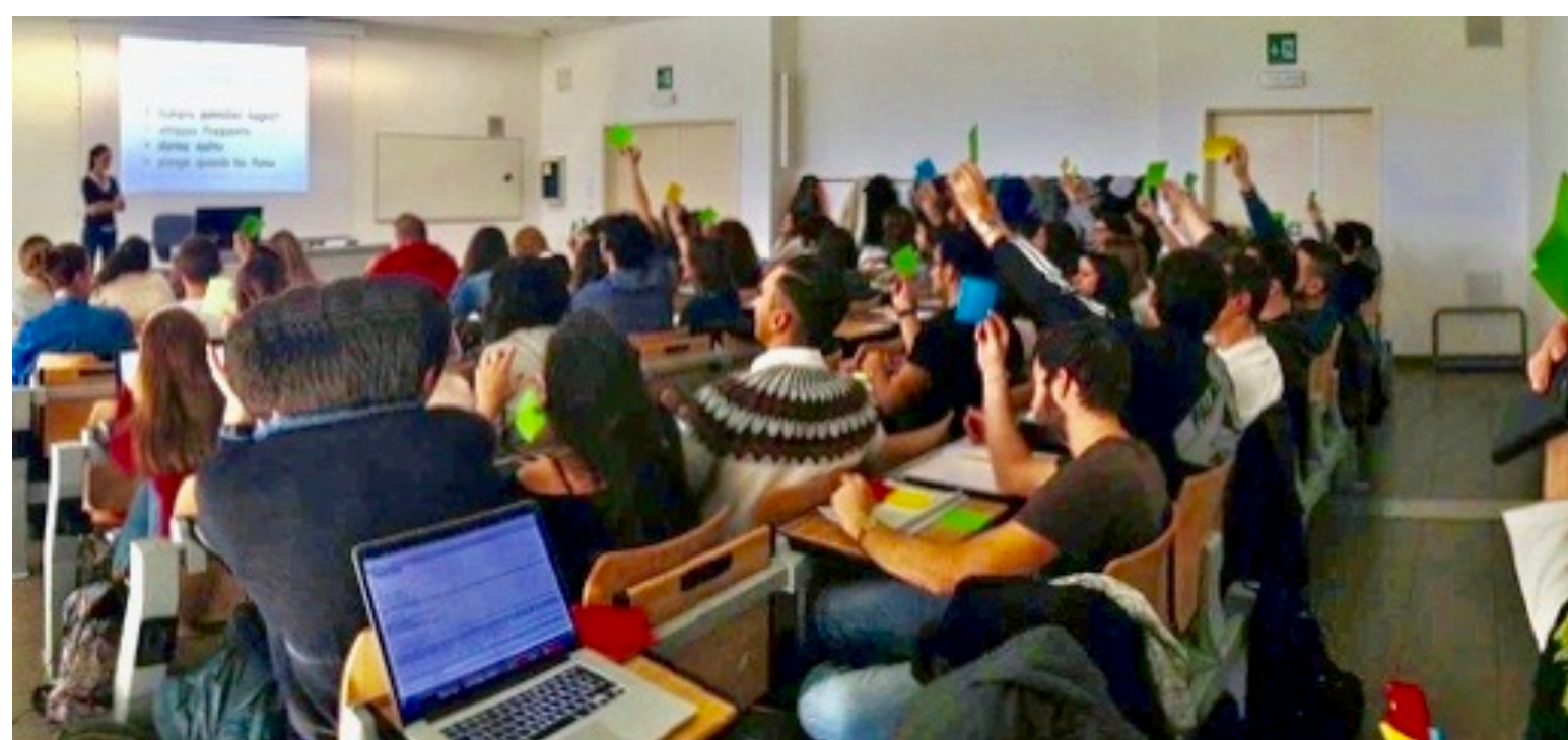
Un momento del seminario: FAQ affrontate tramite Sondaggio Rapido d'Aula

favorire l'apertura e il confronto, proponendo un argomento poco conosciuto agli studenti tramite argomenti costruiti sul confronto tra professionisti al fine di fornire informazioni di riferimento comuni e scientificamente riconosciute